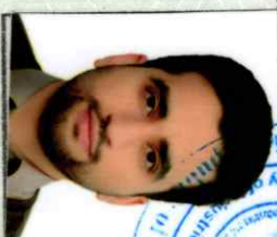
مرستیال / V-President

Mofeed Group Industrial , Manufacturing & Agricultural services