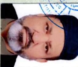
رئیس / President